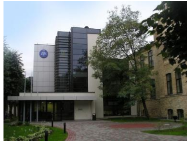
BSA, Lomonosova street, 4.