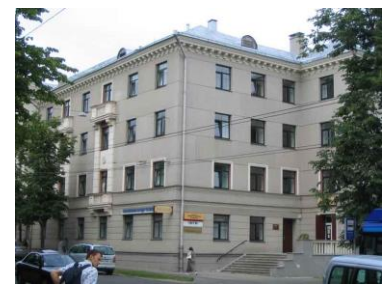
Hotel, Lomonosova street

Балтийская Международная академия – крупнейшее высшее учебное заведение в Балтии (создано в 1992 году), в котором осуществляется билингвальное образование (на латышском и русском языках). В БМА проводится обучение по программам высшего профессионального образования, по программам академического и профессионального бакалавриата, а также профессиональной и академической магистратуры и докторантуры.