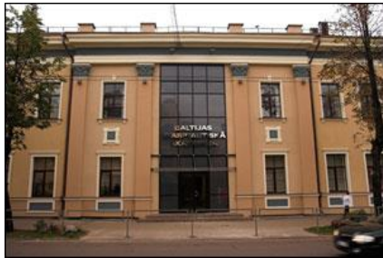
BSA, Lomonosova street, 1.

час езды от г.Риги). Организовать питание (ланчи и обеды) можно за дополнительную плату в кафе БМА.